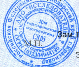
Схема 3с, предусматривающая проведение инспекционного контроля не реже одного раза в год.